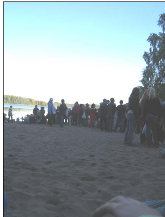
Leiri huipentui suuriin Havaiji-grillijuhliin hiekkarannalla