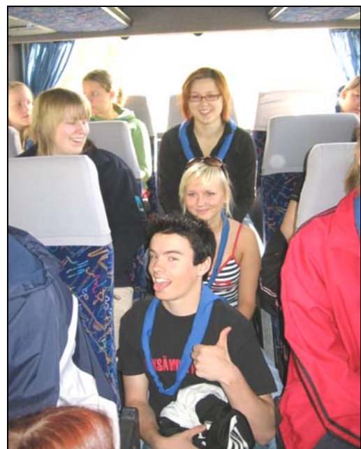
Leiribussissa on tunnelmaa